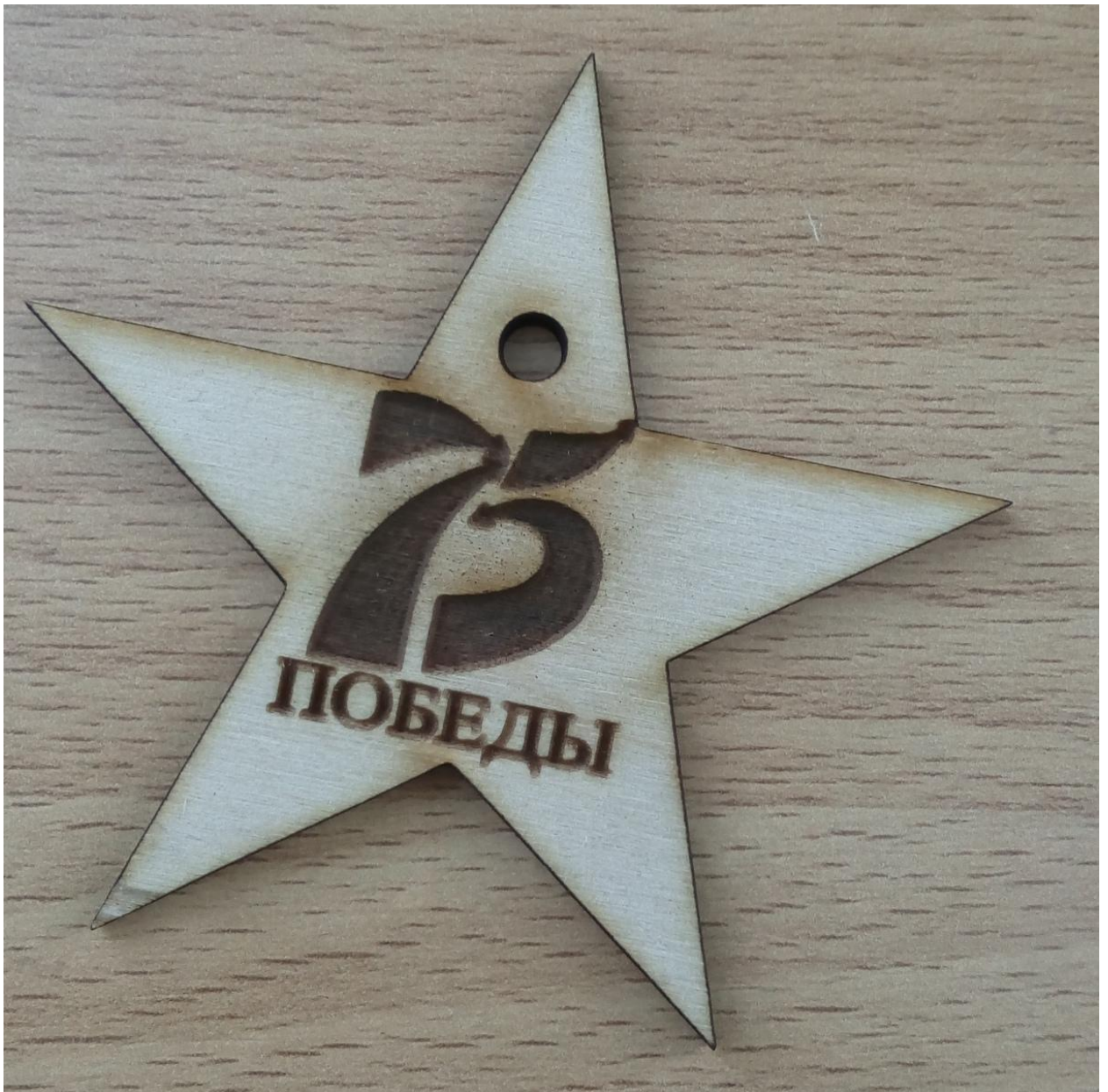
Заготовки для сувениров.